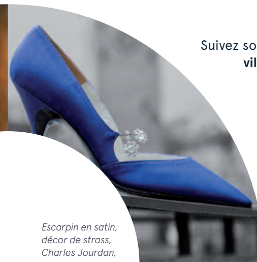
Escarpin en satin, décor de strass, Charles Jourdan, 1969.

Suivez son actualité sur : ville-romans.com