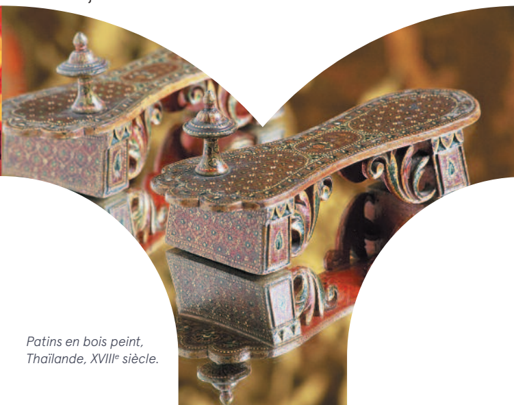
Patins en bois peint, Thaïlande, XVIII e siècle.