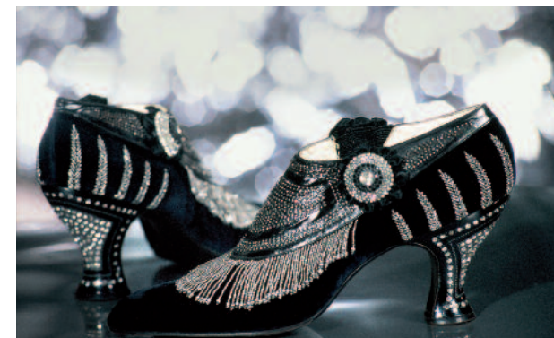
Souliers en velours, décor de perles d'acier et strass, créés par Hellstern, 1925.

Cette exceptionnelle collection de chaussures témoigne des différentes cultures et civilisations depuis l'Antiquité et ne cesse d'inspirer les créateurs d'aujourd'hui.