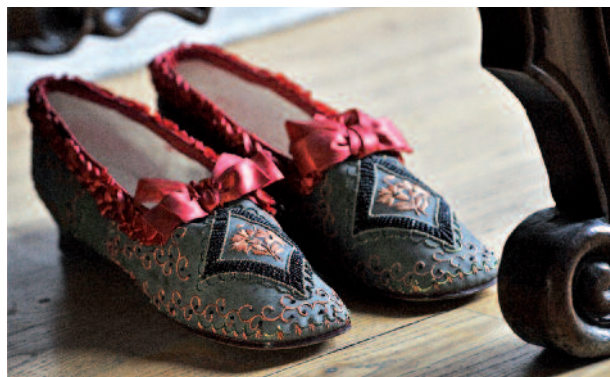
Souliers de femme en veau brodé, Paris, 1855.

to discover the world of this timeless, universal object – the shoe. Its collection is kept in a prestigious setting, the former "Convent of the Visitation", allowing it to display shoes in all its forms, from the oldest to the most contemporary and the most classical to the most extravagant or exotic. Situated in Romans, a town that owes its renown to leatherworking and shoemaking, the international Museum is both a place of endless inspiration for professionals and an exceptional showcase for the famous boot and shoemakers of yesterday and today.