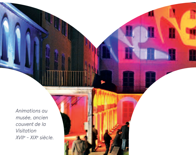
Animations au musée, ancien couvent de la Visitation XVII e - XIX e siècle.

Le musée propose des expositions et une programmation de visites et d'animations tout au long de l'année.