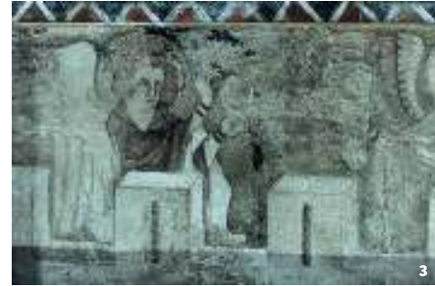
3. Jérusalem Céleste : anges et chemin de ronde. Détails, peinture murale du chœur New Jerusalem: angels and parapet walk. Details, wall painting in choir

Entre 1970 et 1976 d'importants travaux de restauration ont permis de dégager dans le chœur à sept pans un ensemble exceptionnel de peintures murales du XIV e siècle. À la différence de la fresque, celles-ci, d'inspiration méditerranéenne, ont été réalisées sur un enduit sec.