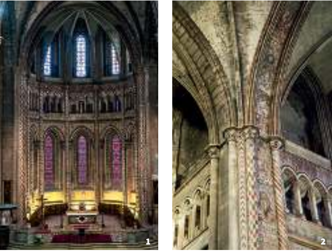
1. Vue générale des peintures murales, XIV e siècle, chœur General view of wall paintings, 14 th century, choir